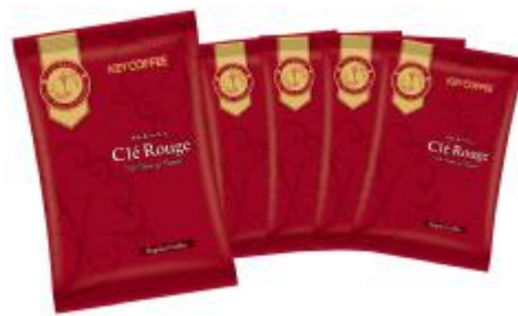
「レギュラーコーヒーチャリティブレンド」イメージ

当社は、コーヒー文化の啓発と被災地復興支援等の社会貢献を目的とした『チャリティセール』を2011年より実施しています。4年ぶりに本社1Fでのリアル開催となる本年は、工場直送の「レギュラーコーヒーチャリティブレンド」を販売するほか、お買い上げの方を対象に、当社商品やグッズなどのプレゼントが当たる抽選会を行います。また、当社公式SNS(Instagram、X(旧Twitter))を通じた投稿イベントも同時開催します。