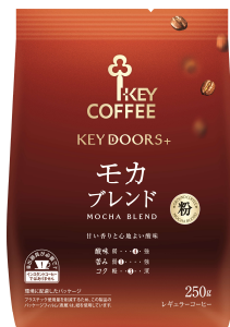
『KEY DOORS+ モカブレンド (FP)』