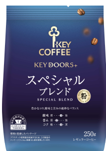
『KEY DOORS+ スペシャルブレンド (FP)』

キーコーヒー株式会社(本社:東京都港区、社長:柴田 裕)は、家庭用コーヒーブランド「KEY DOORS+(キードアーズプラス)」から、大容量粉商品 (FP) 『KEY DOORS+スペシャルブレンド (FP)』と『KEY DOORS+モカブレンド (FP)』を、2024年9月1日(日)より発売。ブランド発足より1周年を迎える「KEY DOORS+」のラインアップを拡充し、多様化する生活者のニーズにお応えしていきます。