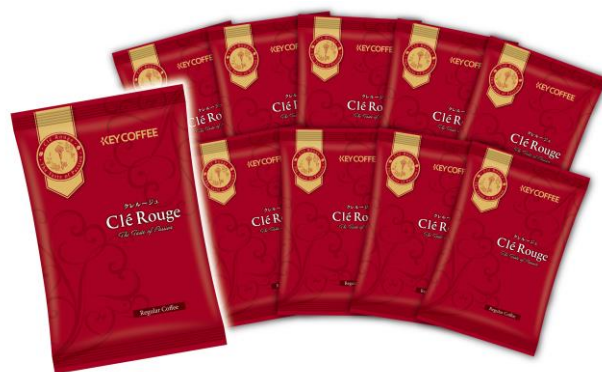
※販売内容イメージ

当社は、コーヒー文化の啓発と被災地復興支援等を目的に、2011年より、本社ビル1階にて『キーコーヒー チャリティセール』を開催しています。セール会場では、チャリティブレンドの販売に加え、コーヒーの試飲提供やお楽しみイベントなどを実施し、コーヒーの魅力を生活者に発信し続けてきました。11回目を迎える本年の『キーコーヒー チャリティセール』は、特設サイト上にバーチャル会場をつくり、全国どこからでも楽しめる「オンライン形式」で開催します。