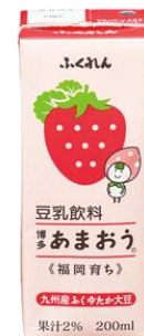
「豆乳飲料 博多あまおう 200ml」