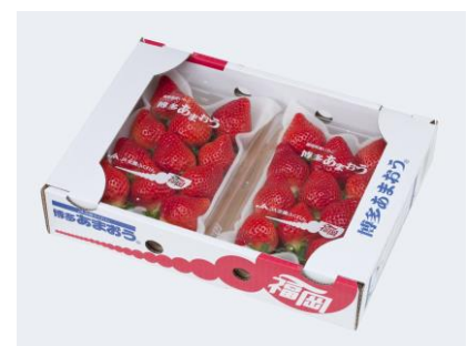
“博多あまおう”イメージ