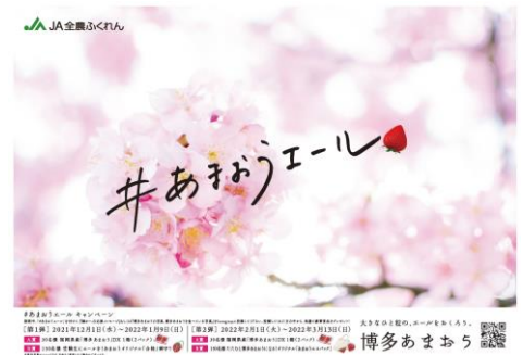
キャンペーンイメージ

特設サイトにて紹介しています。URL: https://jafukuoka.com/amaou_yell/